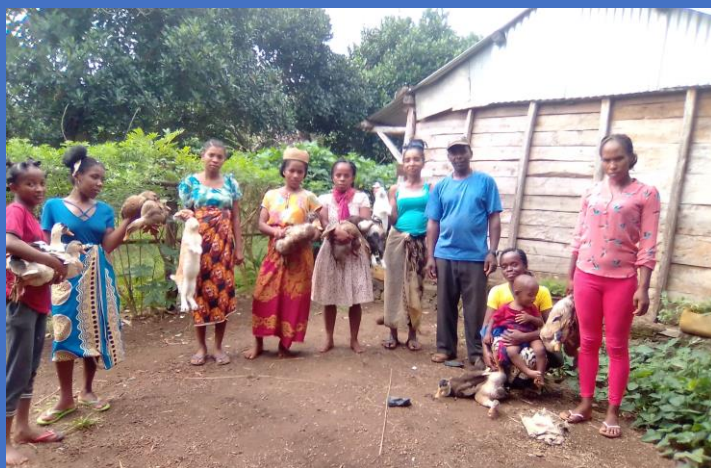
lapins et canards