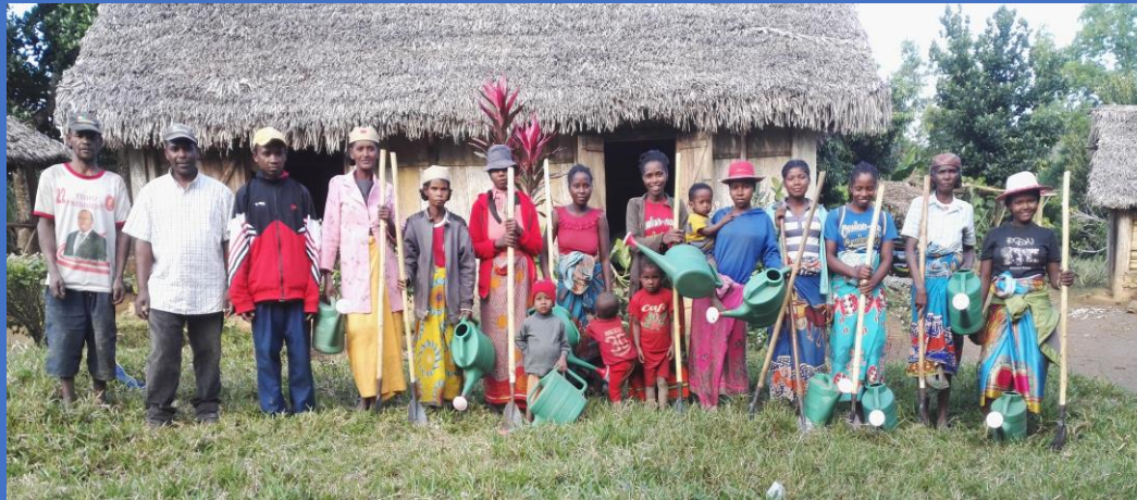
groupe stagiaires et techniciens