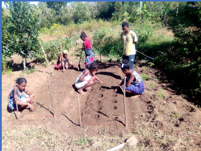
petit jardin d'essai