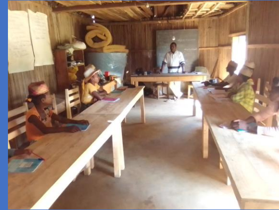
salle multi usage