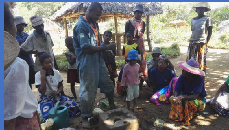
foyer pour économiser le bois