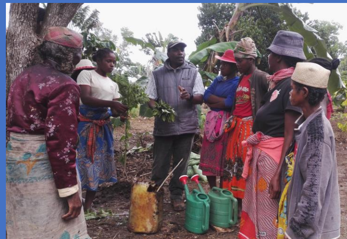
produits sanitaires naturels