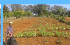
démonstration et production

Ces actions d'entraide et de solidarité se situent dans la région de Manakara / Vohipeno où des formations et accompagnements de producteurs sont déjà engagées. Cela concerne des centaines de famille réparties dans les villages.