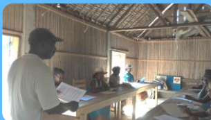
cours et équipements

Microfel a réalisé avec les paysans du sud-est de l'île une cinquantaine de puits pour les besoins en eau. La sécheresse progresse, il faut approfondir les puits dans les villages et réaliser des forages dans 2 fermes-écoles. Ces dernières sont des lieux de formation et d'application de nouvelles techniques agricoles adaptées.