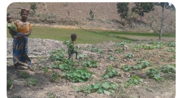
Culture en déficit d'eau