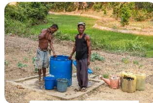
Puits à sec...