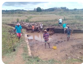
Création de retenues